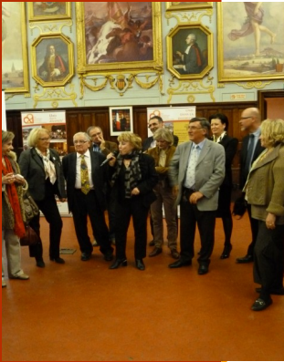
Madame le député Maire était présente parmi nous