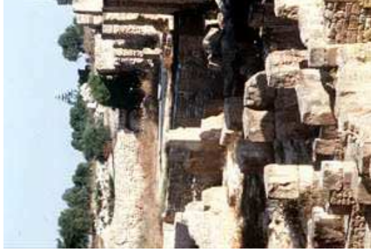
Vue panoramique à partir de la colline de Byrsa

La nature des objets varie dépendant des spécificités de chaque époque : poteries, stèles, sarcophages, sculptures, mosaïques, inscriptions, céramiques et menus objets.